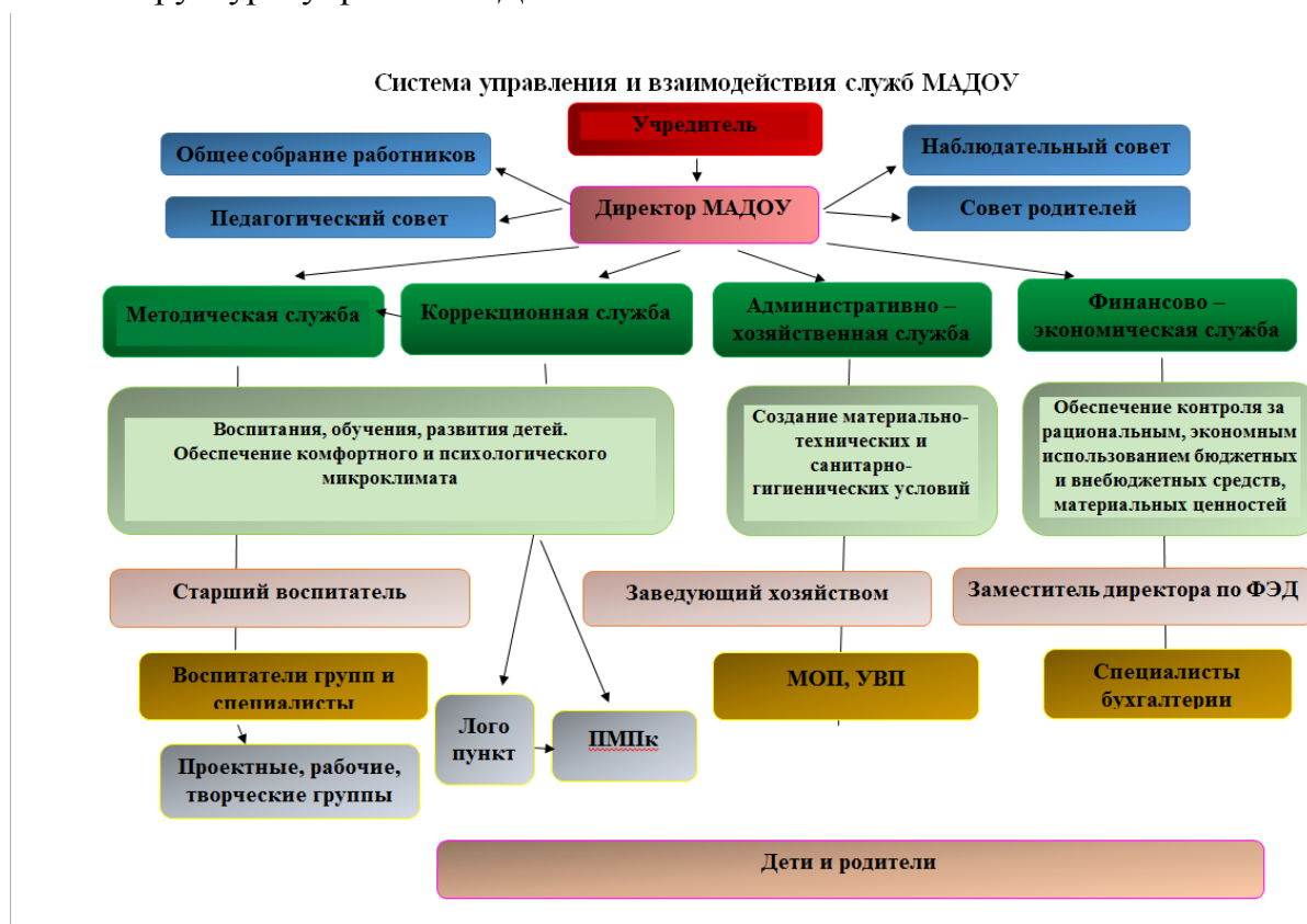
Схема структуры управления ДОУ:

Разработанная структура обеспечивает целенаправленную деятельность, согласованность труда сотрудников, обоснованное воздействие на педагогов, обслуживающий персонал, детей, родителей в целях оптимального решения проблем воспитания и обучения воспитанников. Все уровни структуры взаимосвязаны между собой. Каждый субъект структуры знает свои функциональные обязанности.